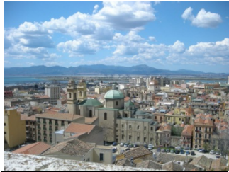
Centro di Cagliari