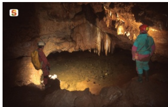
Grotte di Gairo