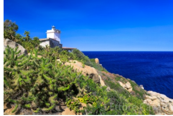
Faro di Capo Ferrato