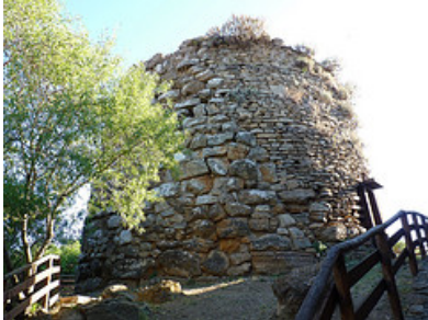
Nuraghe di Armungia