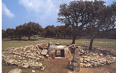
Necropoli di Pranu Mutteddu