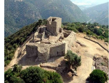
Castello di Sassai